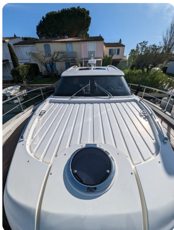
AP 44 Sedan fwd deck