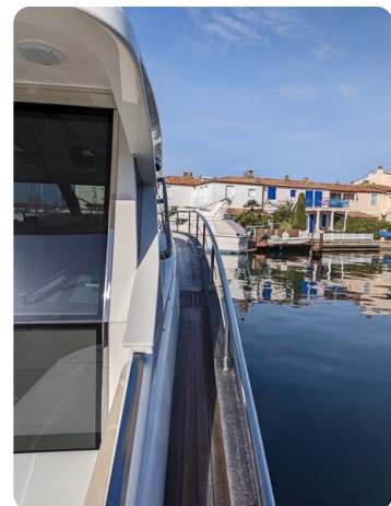
AP 44 Sedan sideways