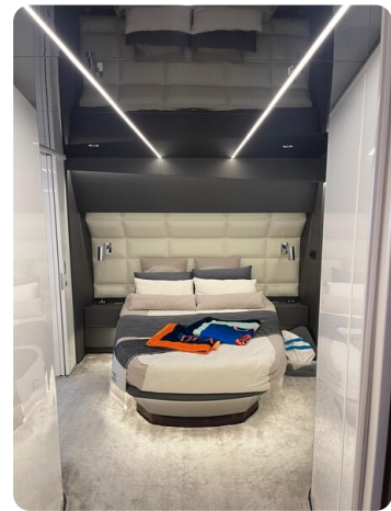
CIAO! cabin details