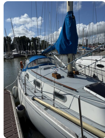
S & S 30 IVALU 3