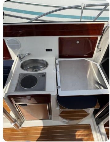
Aquador 23 DC SUND 19