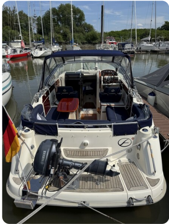
Aquador 23 DC SUND 33