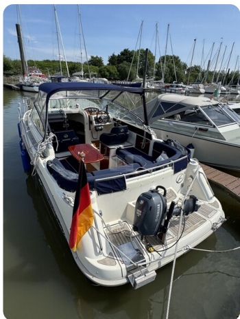
Aquador 23 DC SUND 32