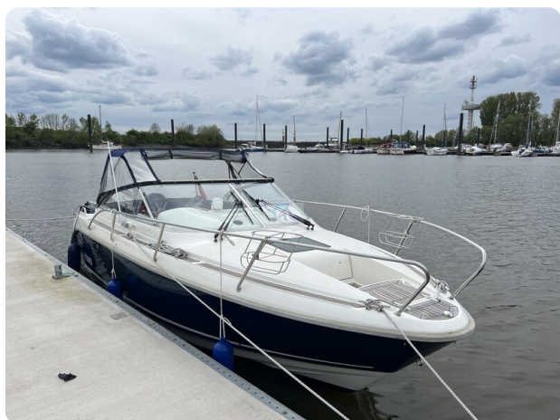
Aquador 23 4