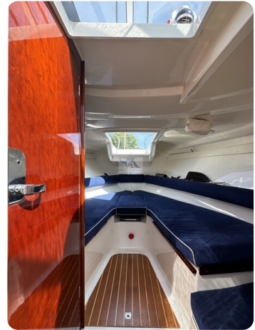
Aquador 23 DC SUND 14