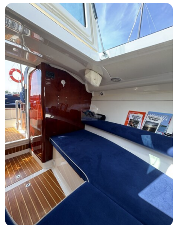
Aquador 23 DC SUND 8