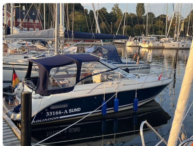
Aquador 23 7