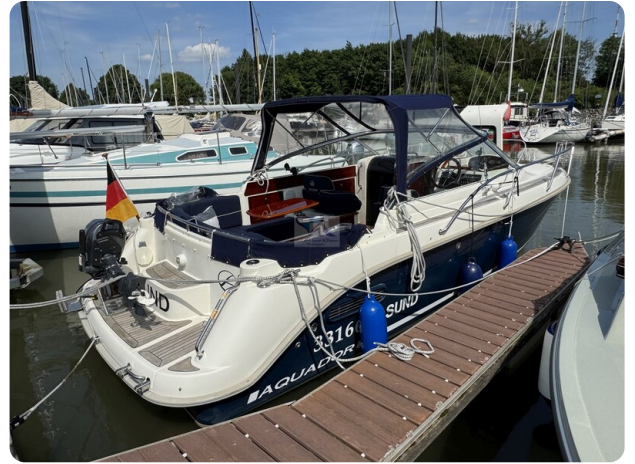
Aquador 23 DC SUND 31