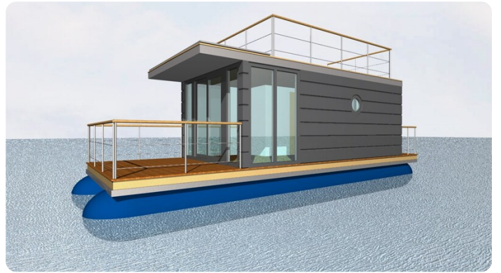
2021.05.17 - kerrafrent VOX trend antracyt - widok 1(2)