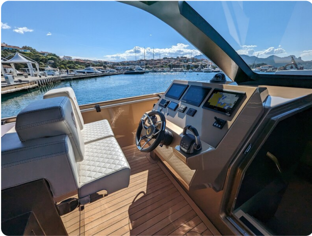
Apex 60 helm station