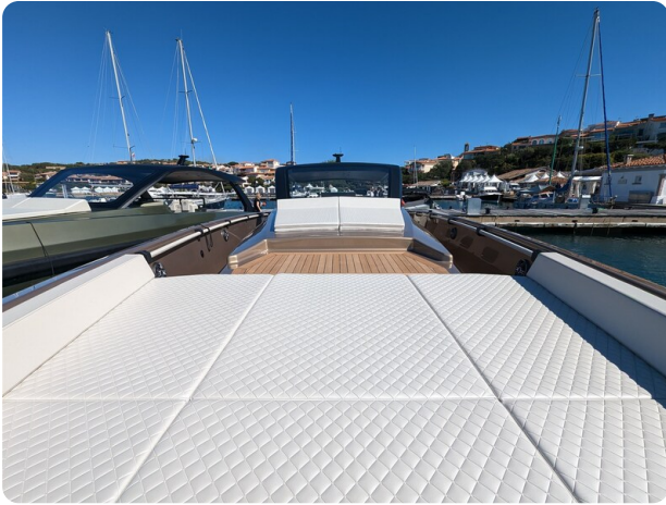
Apex 60 bow sunpad