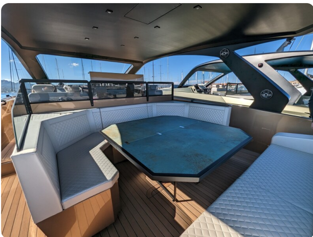
Apex 60 cockpit dinette