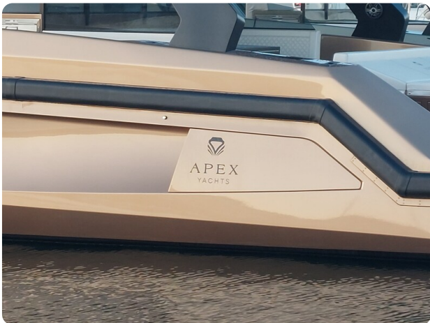
Apex 60 (3)