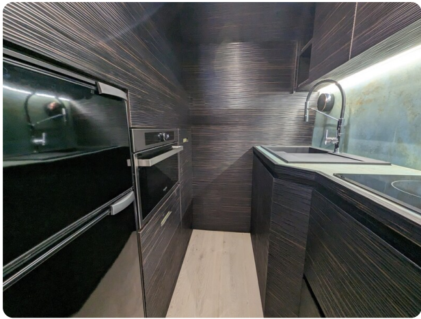
Apex 60 galley