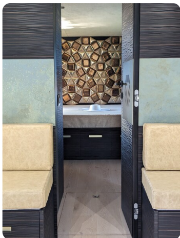
Apex 60 interiors