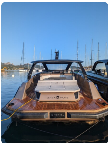
Apex 60 stern view