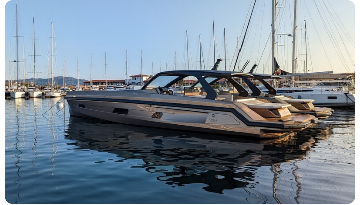
Apex 60 aft profile closed