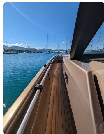
Apex 60 sideways