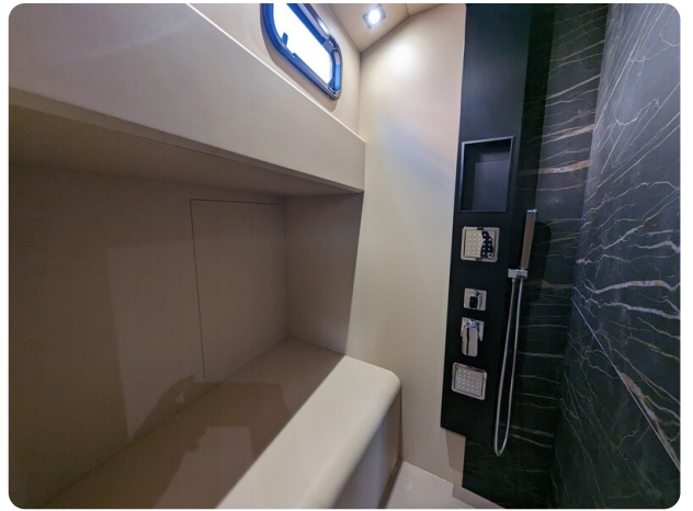
Apex 60 shower