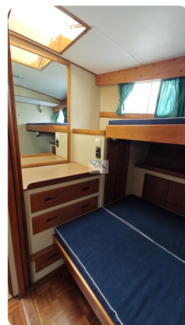
Grand Banks 48_msp789980 18