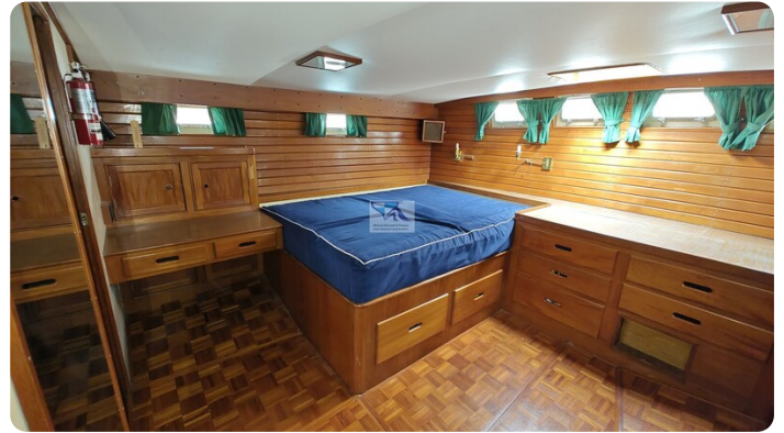
Grand Banks 48_msp789980 48