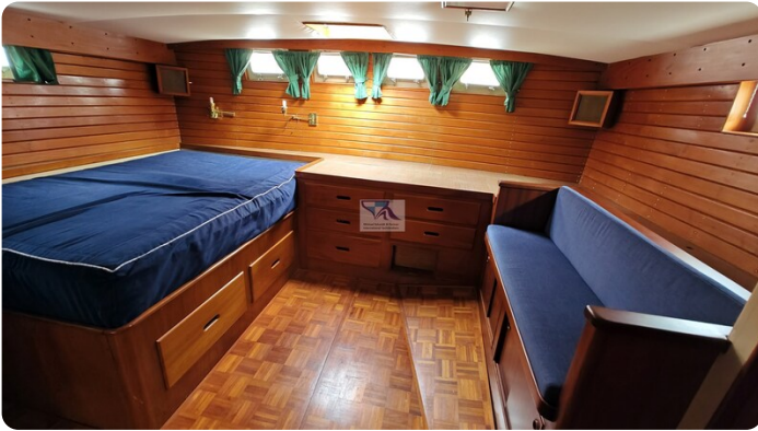
Grand Banks 48_msp789980 50