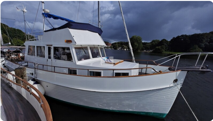
Grand Banks 48_msp789980 66