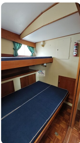
Grand Banks 48_msp789980 17