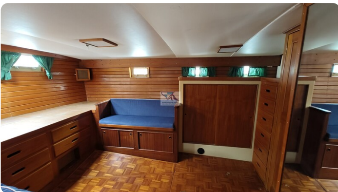
Grand Banks 48_msp789980 51