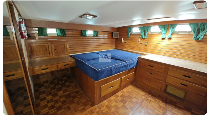
Grand Banks 48_msp789980 48