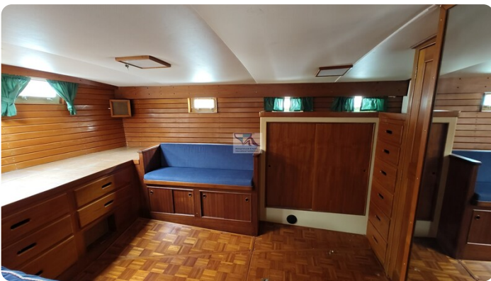
Grand Banks 48_msp789980 51