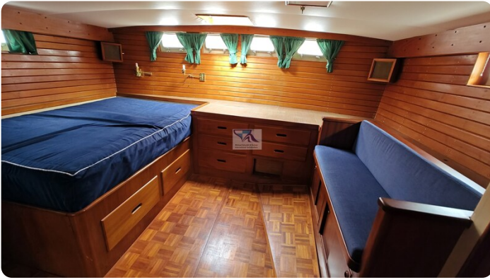
Grand Banks 48_msp789980 50