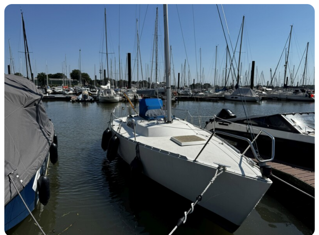
Albin Express 31