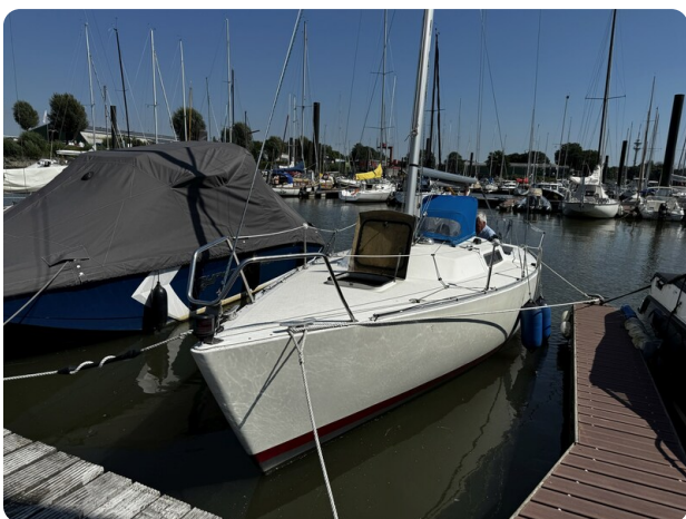
Albin Express 1